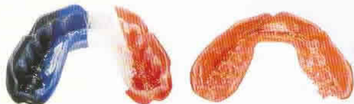
PLAYSAFE protège-dents Boil & Bite protège-dents

En comparant des protège-dents fabriqués de façon individuelle avec des types Boil+Bite (bouillir et mordre) vous voyez des différences significatives. Le protège-dents Playsafe s'applique exactement sur l'alignement des dents, ne bouge pas et permet de respirer librement et, après une courte accoutumance, de parler normalement. Des types Boil & Bite s'appliquent de mauvaise façon et ne restent pas en place. Le sportif doit tenir le protège-dents sur l'alignement des dents et pour cela il est gêné dans son activité. Au Symposium International sur les biomatériaux (1993) Dr. J. Park, PHD a expliqué que les protège-dents Boil +Bite donnent un faux sens de protection en raison d'une importante perte de l'épaisseur pendant l'adaptation dans la bouche.